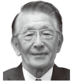
東京都商店街振興組合連合会理事長 東京都商店街連合会会長