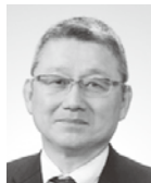
(一社)板橋産業連合会会長