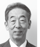
東京商工会議所板橋支部会長